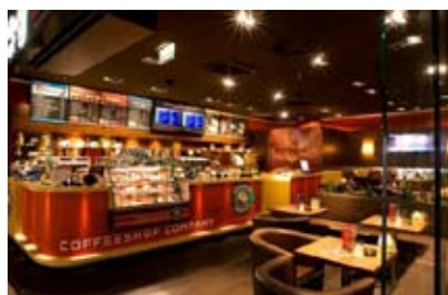
2.) Shop in shop