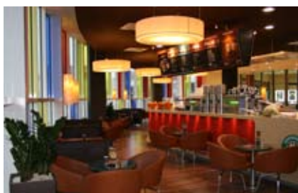
1.) Business Lounge