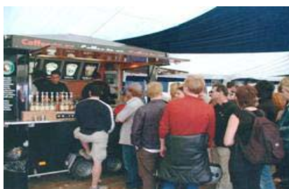
4.) Mobile Coffeeshop