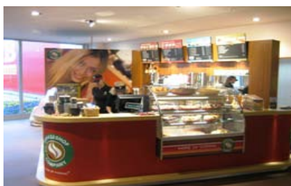
3.) Corner type