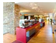
Fotky: Schärff World - centrála spoločnosti v Neusiedl am See v Rakúsku

O úspešnosti tejto kombinácie špeciálnej technológie, kvalitnej suroviny a štýlového konceptu svedčí popularita značky v medzinárodnom prostredí. Distribúcia sa vybudovala v nasledovných krajinách: Rakúsko, Nemecko, Poľsko, Slovensko, Maďarsko, Česko, Slovinsko, Rumunsko, Rusko, Egypt, Turecko a Saudská Arábia. Prevádzky Coffeshop Company sa nachádzajú aj na luxusných výletných lodiach Carnival Cruise Line.